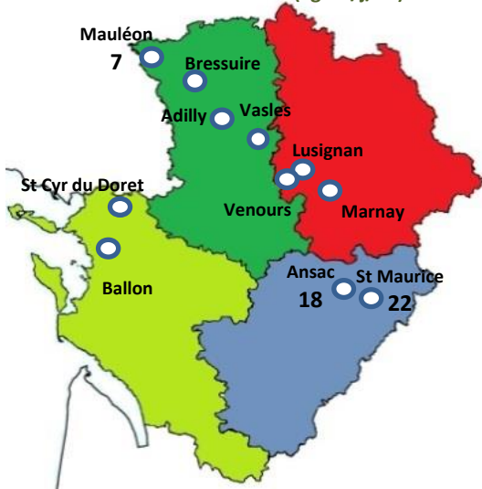
POUSSE DE L'HERBE (kgMS/j/ha)